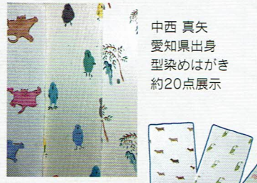
中西 真矢 愛知県出身 型染めはがき 約20点展示