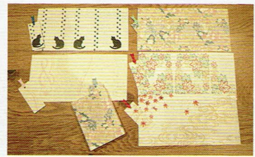
山下 賢二 / 京都府京都市出身 / 西陣織